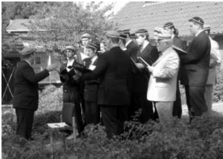
Bei der Chorprobe

»Sängerschaftliche Matinee vor etwa zehn(!) gespannten Zuhörern. Die Studentenlieder funktionieren relativ gut. Doch dann: der Rheinberger! Irgendwie funktioniert nur noch die Hälfte bzw. gar nichts mehr. Aber unermüdlich halten wir aus und bringen