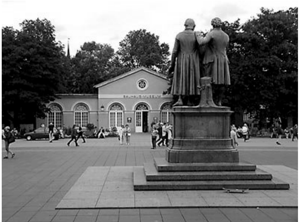
Weimar: Bauhaus Museum

Dieses Jubiläum wollen wir feiern! Ein gelungener Sängerschaftertag ist immer ein Fest vieler, daher möchte ich jeden Sängerschafter aufrufen, sich diesen Termin vorzumerken, um vier unvergessliche Tage in Weimar zu erleben. Neben den Tagungen