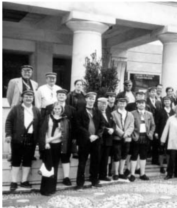
»Tirol-Fahrt 2002« - Die Teilneh-

Den Höhepunkt der Fahrt bildete der Sängerschäftliche Abend mit Törggelen im Weinkeller des Schlosses Rametz bei Meran. Der Skaldenchor, verstärkt durch einige Aktive der Gothen und der Hohensalzbürger, stellte sein Können unter Beweis. Der DS-Renner »Aus der Traube in die Tonne« löste auch hier Beifallstürme aus. Die Skalden hatten in den letzten fünf Jahren über 30 Aktivmeldungen, von denen 24 noch im Bund sind. Derzeit gibt es fünf Fühse, 10 aktive Burschen und 13 Inaktive, davon