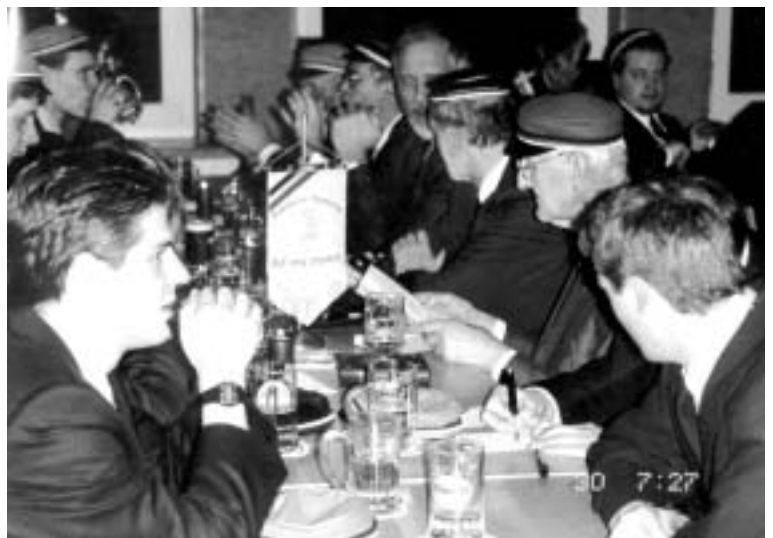
Ausschnitt aus der Korona beim Übergakommers