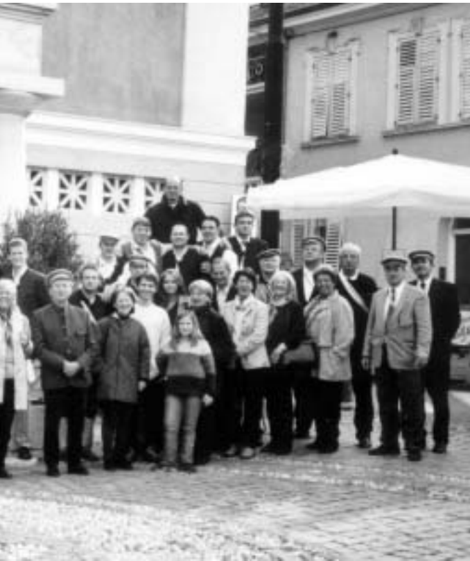
hmer vor dem Theater in Meran

siert, während in den ländlichen Gebieten die deutsche Sprache unangefochten ist. Die Toleranz hat zwar zugenommen, aber immer wieder gibt es Probleme. Das zeigte z.B. der Ausgang einer Abstimmung über die Namensgebung eines Platzes am gleichen Samstag in Bozen.