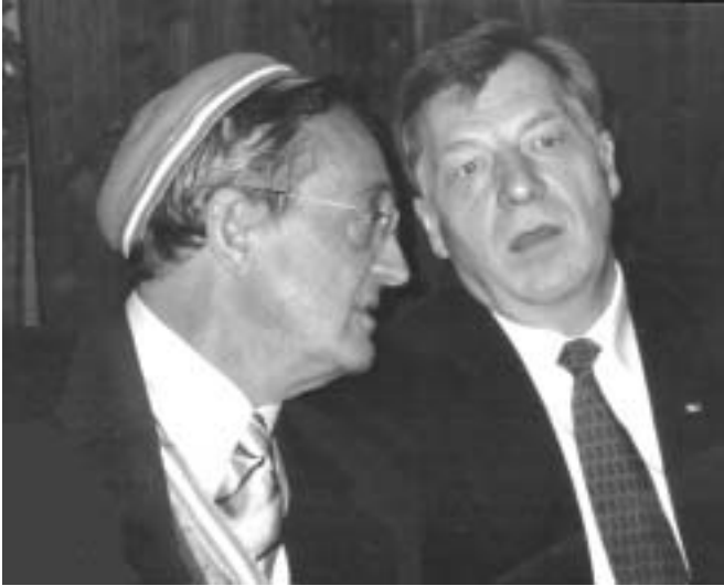
Eberhard Diepgen (ehem. Reg. Bürgermeister) im Gespräch mit Vbr. Wilm Kittelmann

Im renovierten Kneipsaal und in den angrenzenden Räumen des Borussenhauses in der Genthinerstraße - im Herzen der deutschen Hauptstadt - herrschte drangvolle Enge. Der Festkommers aus Anlass des 50. Stiftungsfestes der S! Borussia Berlin