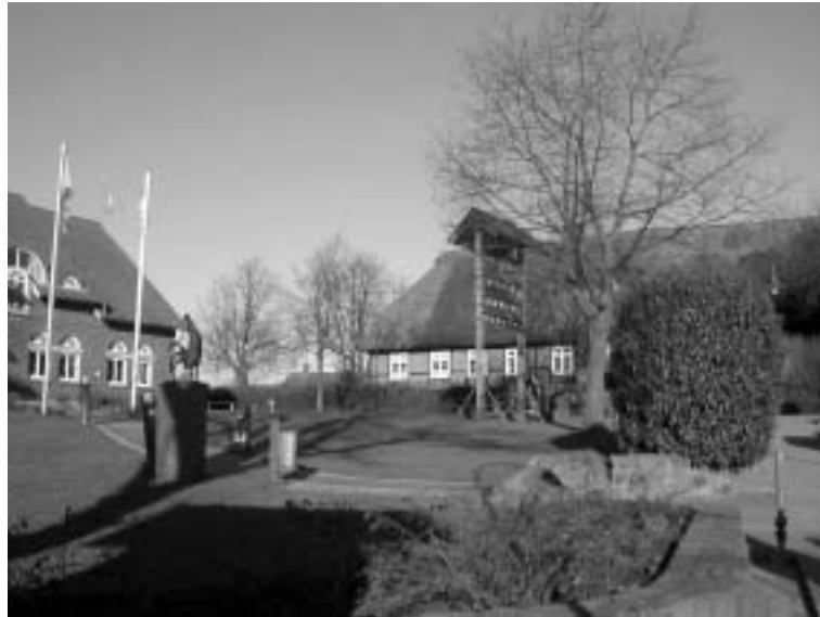
Die Jugendherberge Schönwalde

09:30 - Beginn der Chorprobe. Einsingen und los geht's. Münchner haben ernste Probleme mit