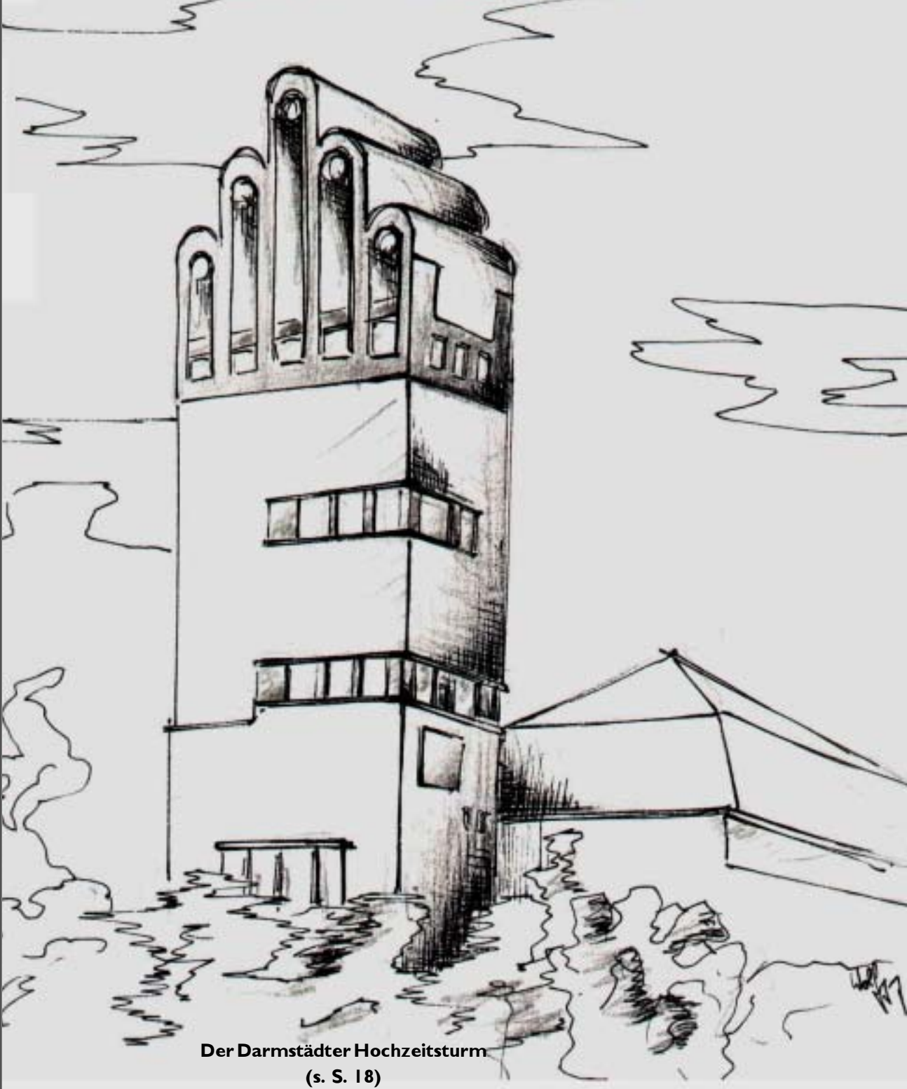
Der Darmstädter Hochzeitsturm (s. S. 18)