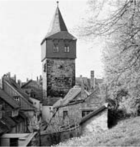
Kehrwiederturm in Hildesheim

Natürlich ist dieser Sommer auch hier bei uns in Hildesheim ziemlich verregnet, Grillpartygastgeber, Eisdielenbetreiber und Open-air-Veranstalter haben allen Grund zu lauten Klageliedern, und die Landwirte wissen auch nicht recht, wie sie das Ganze finden sollen.